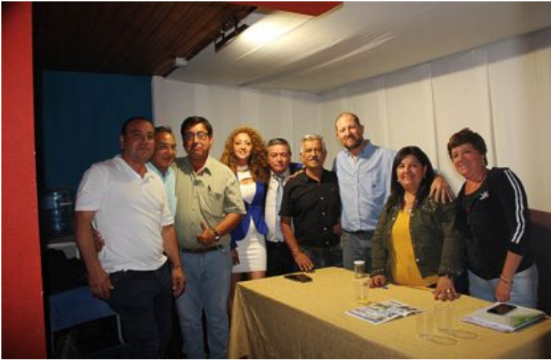
Foto postulantes diciembre de 2019 junto a Comisión Electoral

El 13 de diciembre se realizaran las elecciones en el Sindicato de Trabajadores a Honorarios de la Municipalidad de Maipú (STH). El horario de recepción de votos es desde diciembre desde las 10:00 a las 18:00 horas.