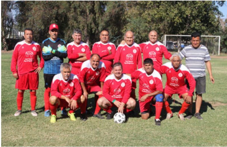
Senior "E" Unión Portales