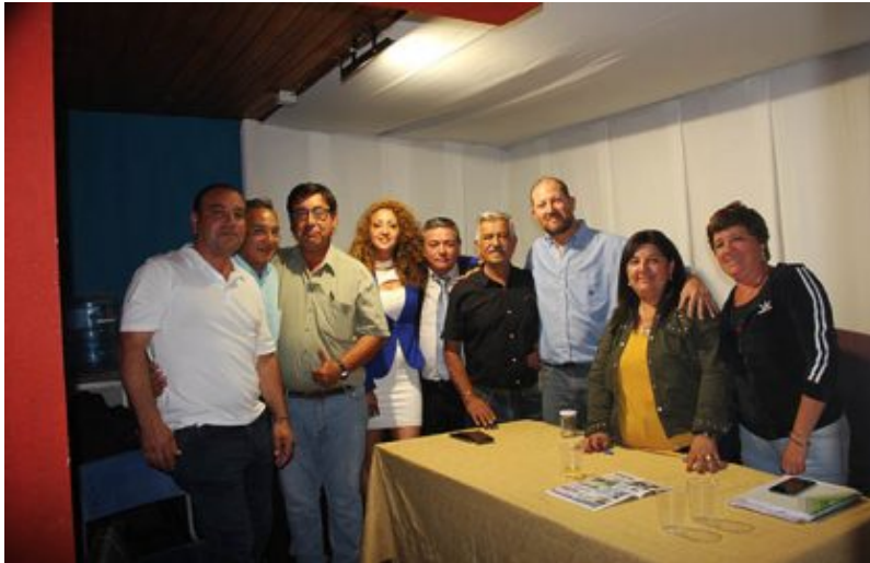
Foto postulantes diciembre de 2019 junto a Comisión Electoral

El 13 de diciembre se realizaran las elecciones en el Sindicato de Trabajadores a Honorarios de la Municipalidad de Maipú (STH). El horario de recepción de votos es desde diciembre desde las 10:00 a las 18:00 horas.