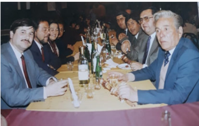
Foto: Segundo aniversario del Día del Dirigente celebrado en lo que fue el