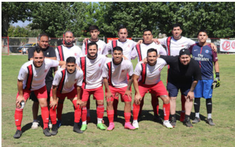
Segunda adulto de Unión Portales.

Cañón Alonso está con ganas de sumar suficientes puntos de manera de mantener su quinto lugar ya que es difícil que aspire a desplazar a Centenario del 4º lugar, 36 puntos más arriba. Otro tanto tiene que sumar ya que quien está sexto en la tabla, deportivo Maipú, está a solo 2 puntos.