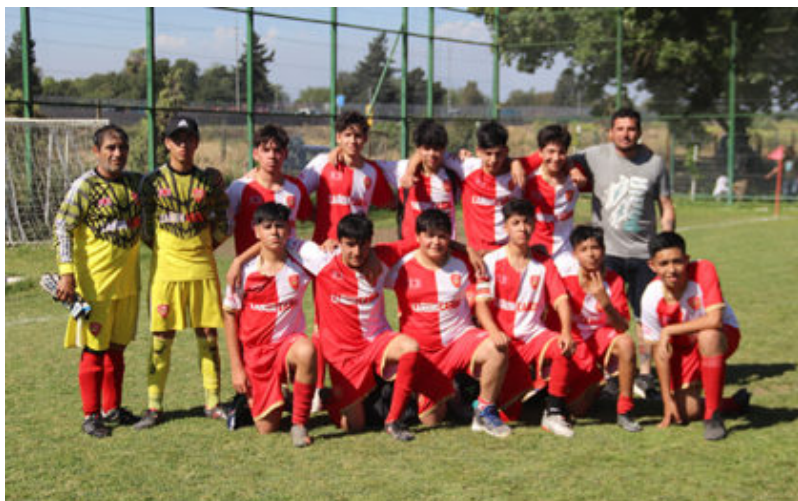
Segunda infantil de Cañón Alonso.

Tiene 128 puntos y está en el 5º lugar, bajo Viveros que suma 130 y Deportivo que suma 131 y está en el 3er lugar. Séptimo juega esta séptima fecha de local precisamente ante Deportivo Maipú y para superarlo en la tabla debe ganar al menos 3 series infantiles, mientras que Deportivo con 2 series que triunfe mantendrá el tercer lugar.