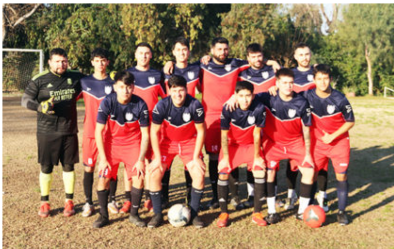
TABLA OFICIAL TIENE DE LIDER A CAMPOS DE BATALLA