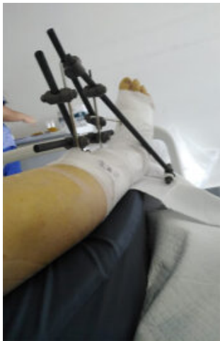
Foto enviada hoy tras intervención.