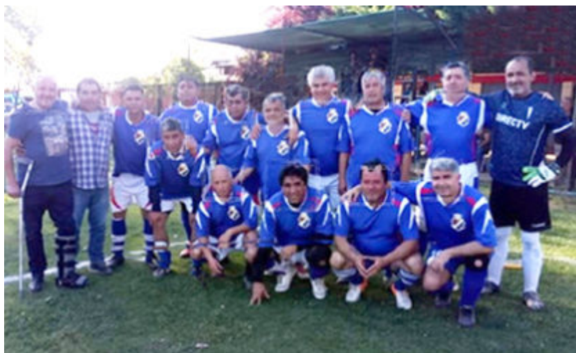
Senior "D" campeón