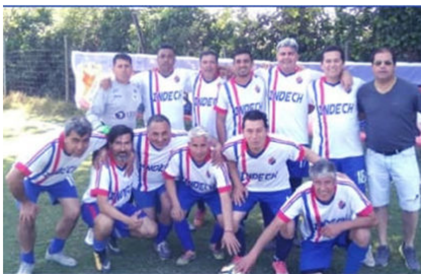
Senior "C" campeón