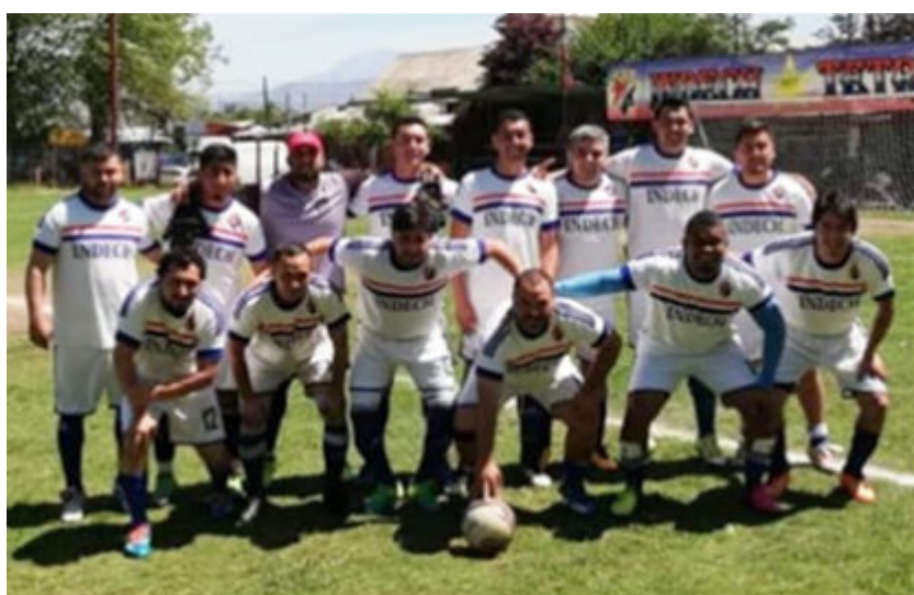
Senior "A" campeón