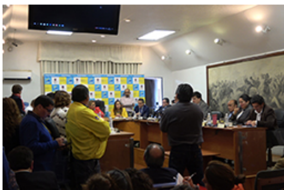
Actual Concejo Municipal