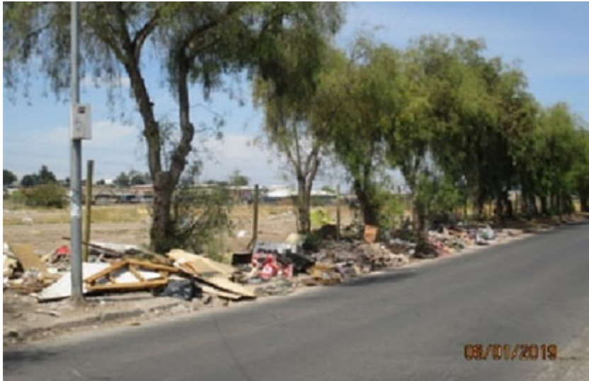
Foto de micro basurales enviada por la Coordinadora

Sin duda que los micro basurales no se crean solos, son vecinos del sector o cercanos al lugar que buscan deshacerse de artefactos y escombros a sabiendas que perjudican a otras personas y eso tiene un nombre: mal vivir; empero los afectados deben buscar soluciones y en eso esta empeñada la Coordinadora de Organizaciones Sociales del Barrio Lo Errázuriz que hacen un llamado a 8 diputados del distrito 8