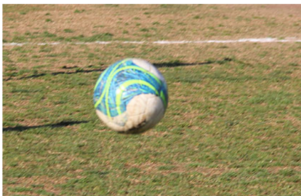
TABLA Y RESULTADOS OFICIALES DEL TORNEO DE LA ASHIMA

Este jueves 11 de julio se entregaran los resultados oficiales de la segunda fecha del Campeonato Oficial de la ASHIMA, gentileza de la directiva por los problemas ocurridos durante esta semana, donde no hubo información de parte del club de turno, salvo lo recolectado en canchas, información telefónica nos complicaron los resultados tras consultas a diferentes personas cuyos resultados no coincidían.