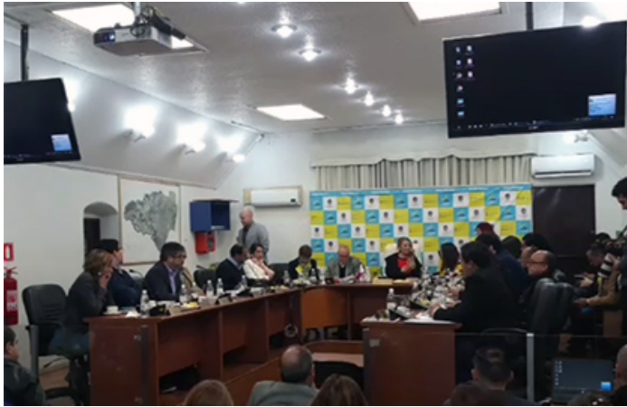
Foto Concejo