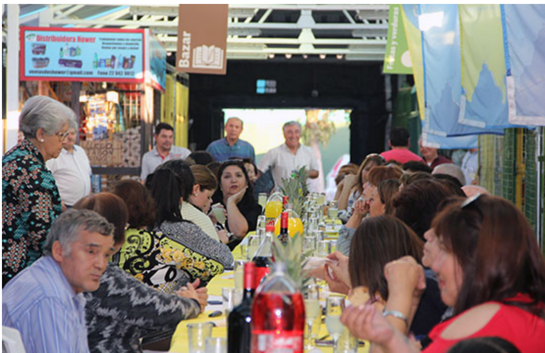
Celebran Día de la Madre en el Mercado Municipal de Maipú