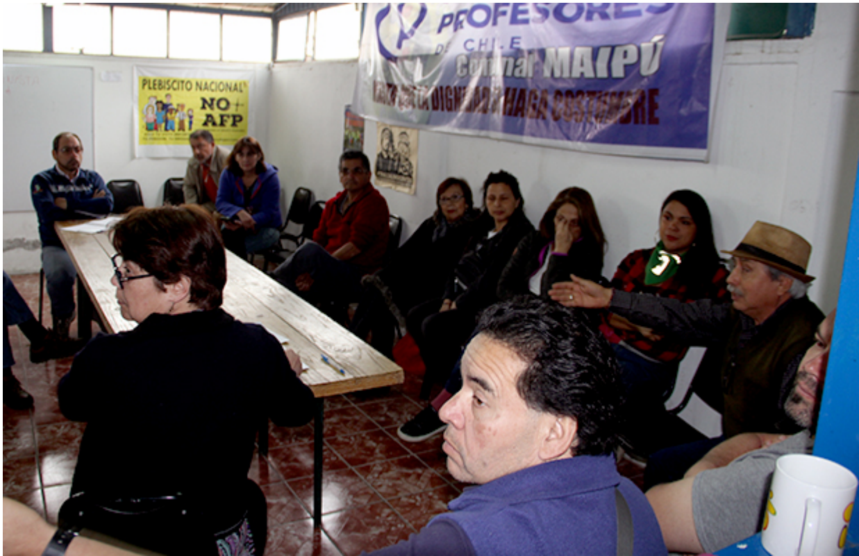
LAS SIETE MEDIDAS