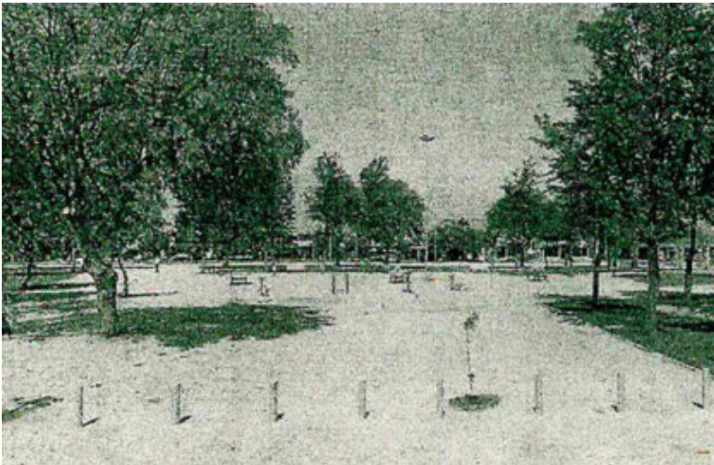
San Martín con Tres Poniente