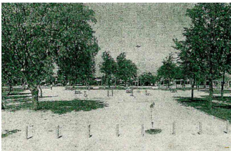
San Martín con Tres Poniente