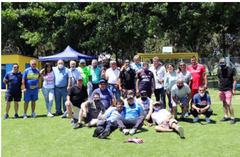
Reinauguración Estadio Florida Loma Blanca