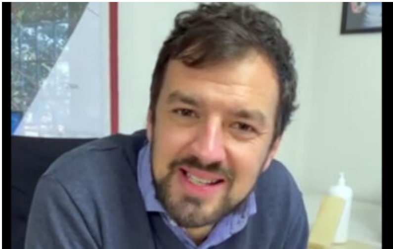
Alcalde Tomás Vodánovic.

Tomás Vodánovic, alcalde de Maipú, entrega estrategia para dar solución a la problemática que enfrenta en las finanzas municipales donde denuncia un déficit aproximado de 34 mil millones de peso, poco menos del 30% del presupuesto anual. En un comunicado a los trabajadores municipales da a conocer los pasos a seguir que van desde la auditoria, desvinculaciones, términos de contratos proveedores, renegociación de deudas e interponiendo “las acciones legales que correspondan ante los tribunales de justicia para hacer efectivas las eventuales responsabilidades penales y civiles de las personas involucradas”.