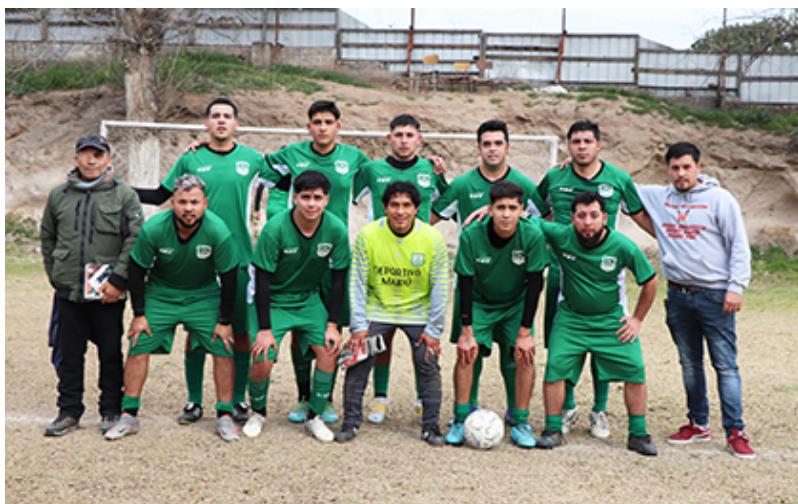
Tercera adulta de Deportivo Maipú

Deportivo Maipú juega de local frente a Abrazo de Maipú en la cancha de éste último. Paradojal, pero Deportivo hace valer su condición de local en esa cancha y sin duda que ambos se la jugaran por mejorar en la tabla de posiciones, con un deportivo que se mantiene en el cuarto lugar, pero ocupó el segundo lugar solo hace unas semanas y con muchos sueños. Por su parte Abrazo de Maipú esta recién tomando el ritmo del campeonato, con algunos jugadores que regresan, pero con falencias en la constancia.