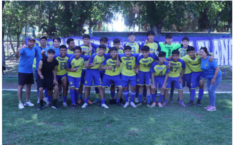
Tercera Infantil Florida Loma Blanca

El replanteo de Florida Loma Blanca para tener dos campeonatos paralelos signífico más trabajo para sus directivos, pocas veces comprendido, de modo de adaptarse a jugar en dos Asociaciones para dar espacio a sus jugadores a vestir de corto semanalmente en 11 series.