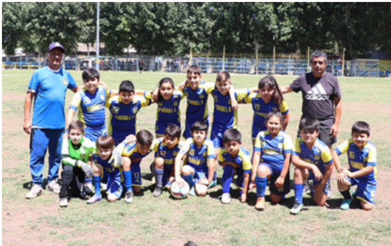
Cuarta Infantil Florida Loma Blanca

de los noveles jugadores (menores de 11 años) celebraran en grande este domingo cuando los Directivos de la Asociación Rural El Maitén entreguen los trofeos a los niños, que será extensiva también a otros campeones: tercera infantil.