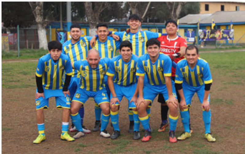
Primera adulto de Florida Loma Blanca.

Florida Loma Blanca viaja al Maitén a jugar en la novena fecha ante Pajaritos, completando la primera rueda del torneo oficial de la Asociación Rural “El Maitén”.