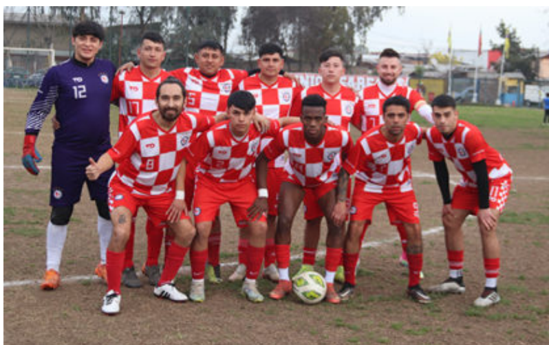
Primera adulto de Farfana

Esta semana no contamos con resultados y tabla.