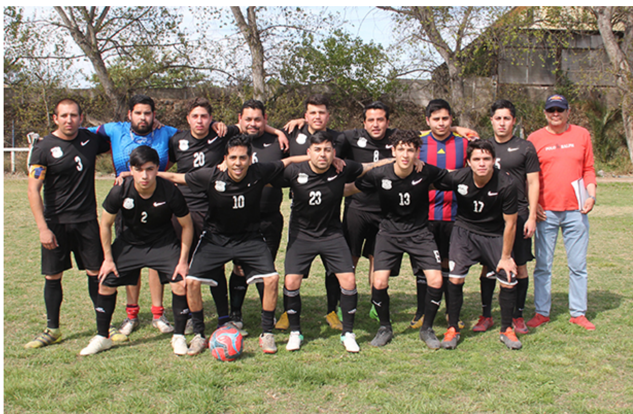
Segunda Adulto Campos de Batalla