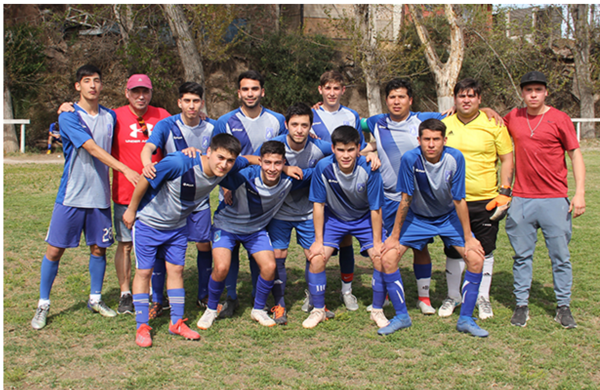
Segunda Adulto Abrazo de Maipú