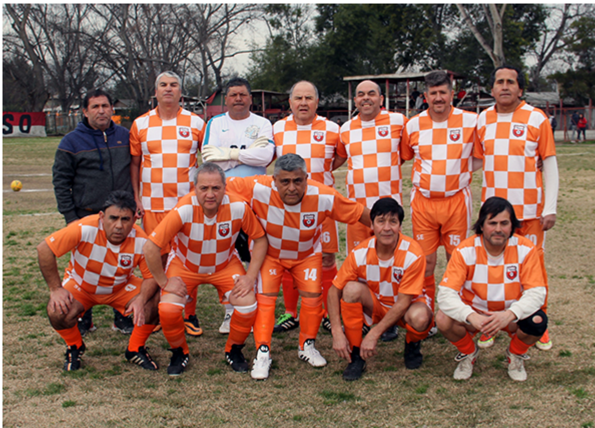
Tabla oficial. Este fin de semana juega de visita Florida Loma Blanca con Unión Viveros que viene de sumar importante puntos ante Abrazo de Maipú y busca quedar en el mejor lugar de la tabla en momentos en que Abrazo de Maipú cumple su fecha libre. Tanto Viveros como Florida parte el juego con 3 puntos pedidos por suspensión de series.