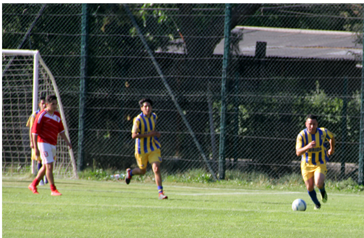
Tabla y resultados 6ª fecha de la segunda rueda, que nos fue imposible entregar ayer por temas logísticos de los cuales no nos confiaremos en próximas fechas.

Florida Loma Blanca sumó 20 puntos de distancia sobre Abrazo de Maipú que tuvo una fecha “naranja” que desea olvidar, cumpliendo esta semana, la última fecha que se juega este año