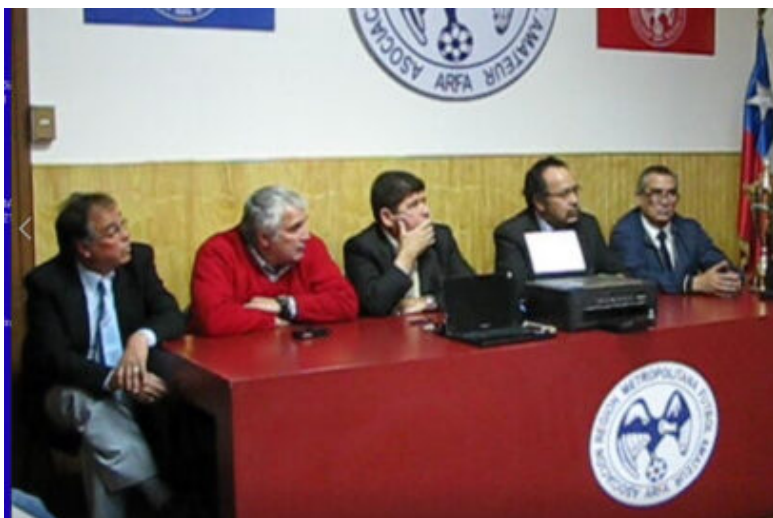
Directorio ARFA, foto archivo.

. Solo pedir que en su viaje celestial lo reciba el Gran Dios, que le dará conformidad a la familia ante tan doloroso momento.