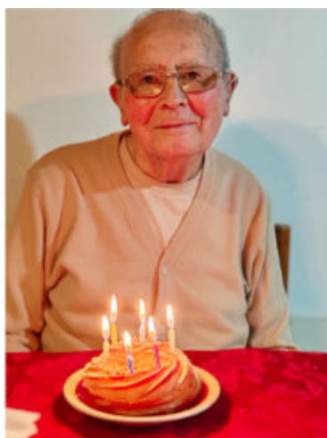
Foto del 14 de marzo de 2025 cuando cumplió 94 años.

Preocupación en círculos cercanos al ex alcalde de Maipú luego que observaran que ya no está en su querida casa ubicada en el Pasaje Isla de Pascua, pasaje ubicado entre Manuel Rodríguez y Hermanos Carrera, vereda sur de calle Chacabuco.