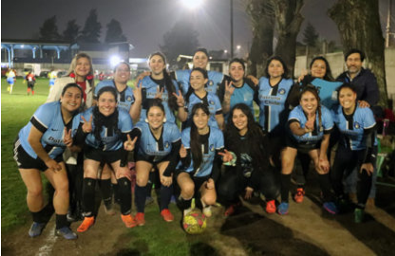
Patrona de Chile