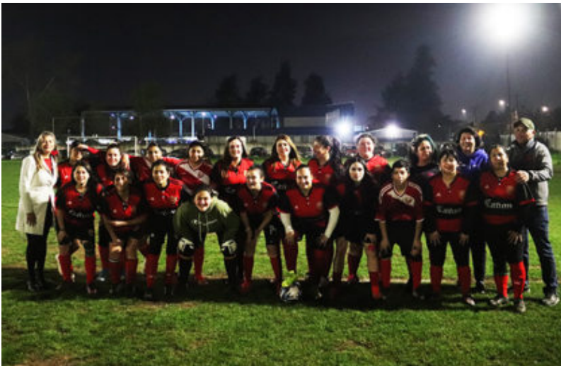
Cañón Alonso "B"