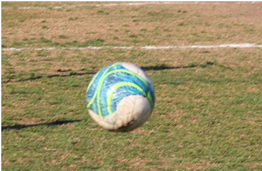
TABLA OFICIAL Con algunos puntos que quitar y sumar en la tabla de posiciones entregada este jueves en la noche a los delegados de club, se dio paso a la disputa de la tercera fecha de la segunda rueda, la 14 o del Campeonato