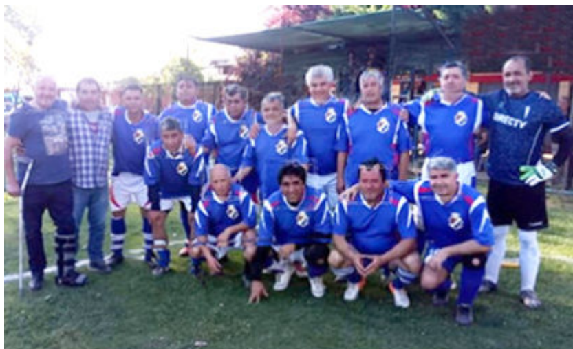
Senior "D" campeón