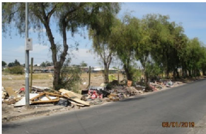
Foto de micro basurales enviada por la Coordinadora

Sin duda que los micro basurales no se crean solos, son vecinos del sector o cercanos al lugar que buscan deshacerse de artefactos y escombros a sabiendas que perjudican a otras personas y eso tiene un nombre: mal vivir; empero los afectados deben buscar soluciones y en eso esta empeñada la Coordinadora de Organizaciones Sociales del Barrio Lo Errázuriz que hacen un llamado a 8 diputados del distrito 8