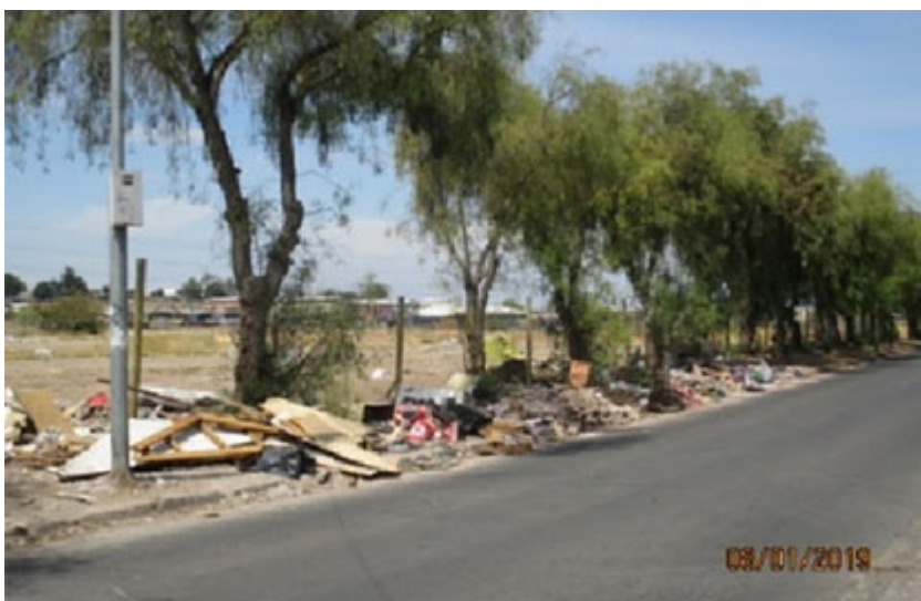
Foto de micro basurales enviada por la Coordinadora