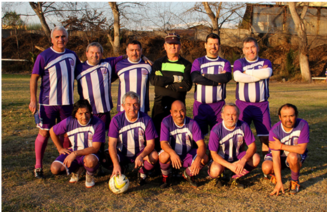
Senior D Real Flandes