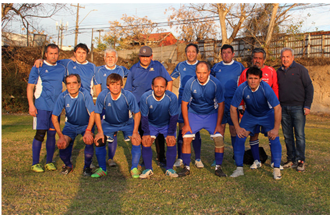
Senior D Abrazo de Maipú