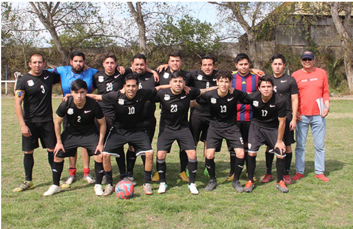
Segunda Adulto Campos de Batalla