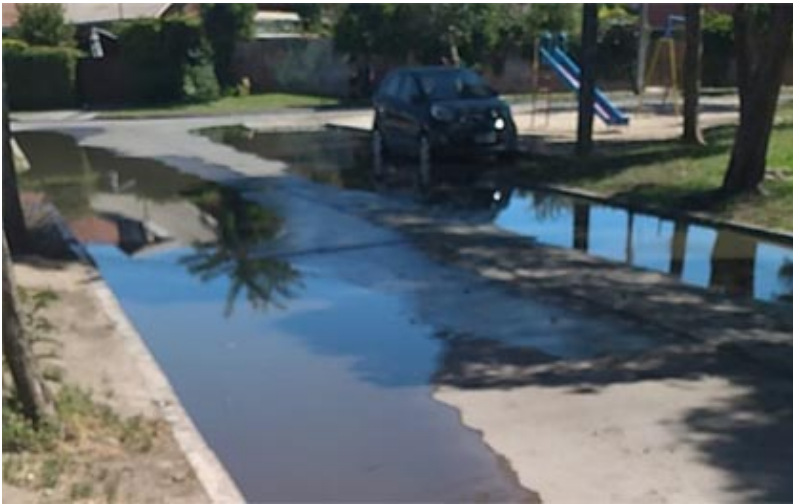
Escape Pozo al Monte

A juicio del presidente de la junta de vecinos de Cuatro Alamos, el sector suyo y aledaño tiene complicado a sus vecinos y los de los sectores afectados con escapes de agua potable y reventones de aguas servidas, para lo cual envió las fotos correspondientes a este medio de comunicación luego de agotar las instancias de reclamos a Smapa.