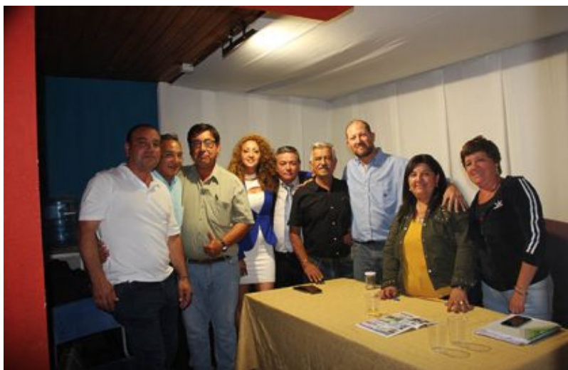
Foto postulantes diciembre de 2019 junto a Comisión Electoral

El 13 de diciembre se realizaran las elecciones en el Sindicato de Trabajadores a Honorarios de la Municipalidad de Maipú (STH). El horario de recepción de votos es desde diciembre desde las 10:00 a las 18:00 horas.