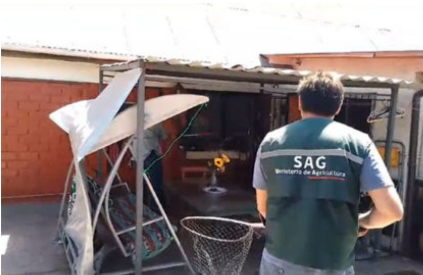
Capturan un zorro en