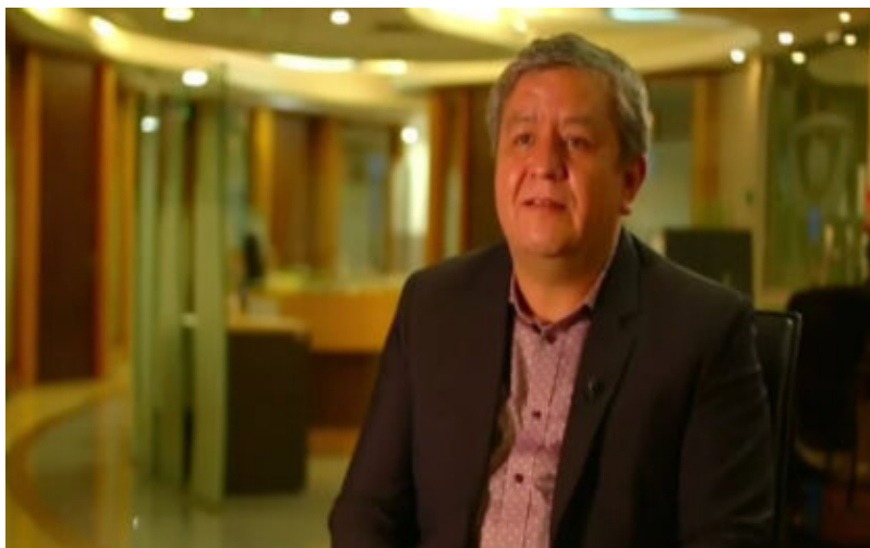
Fiscal Adjunto de Alta Complejidad, José Solís

El levantamiento de cámaras y el cruce de información permitió recuperar 11 vehículos robados en “portonazos” y “encerronas”, a los cuales se les modificaban sus números de serie para luego ser comercializados en distintas regiones del país.