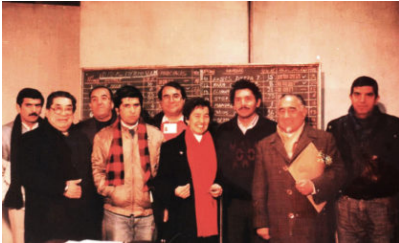
Foto de la historia que marca el día en que se realizaron las elecciones que democratizaron la Unión Comunal de Juntas de Vecinos de Maipú, cuando costaba usar bufanda roja.