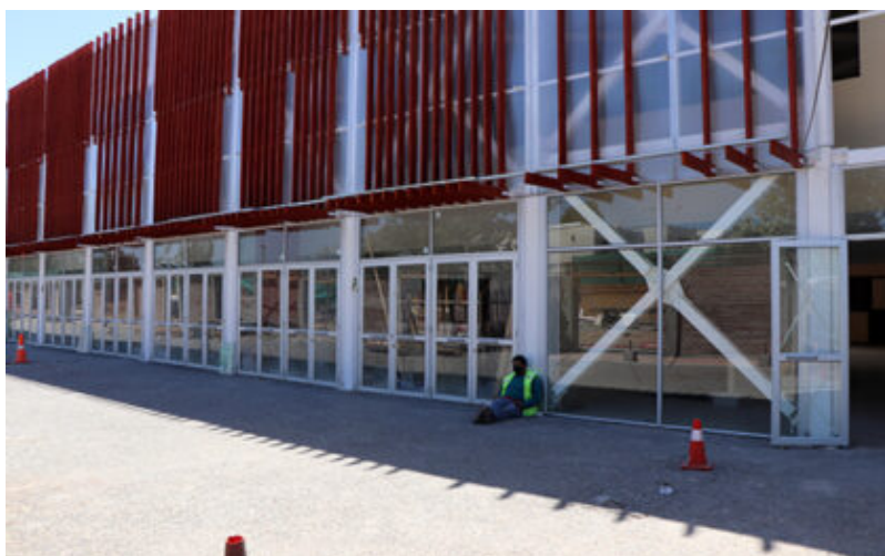
Acceso sur del nuevo Mercado Municipal

A la fecha, Maipú está en la fase 2 de la pandemia, situación que restringe la atención en locales cuyo rubro no sea esencial, calificación que entregan para diferenciar a productos alimenticios o que guarden relación con la pandemia, tema que sin duda implica una obligación difícil de implementar, aunque la obligatoriedad es para quienes a la fecha emitan facturas electrónicas, mientras que para quienes a la fecha no estén emitiendo, el inicio será el 1' de marzo de 2021.