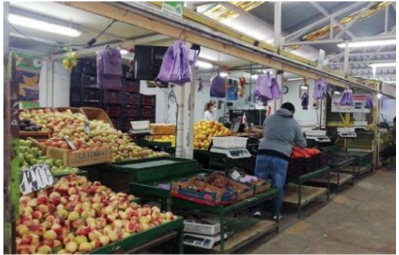
Frutas y verduras en el Mercado transitorio actual.

La jornada de información tributaria está fijado a las 15:00 horas.