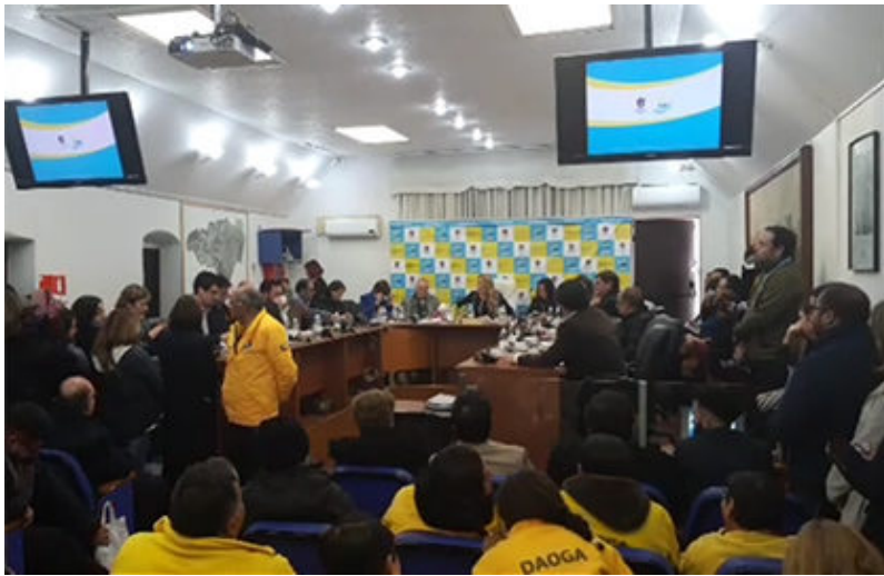
¿Se mantendrá el telón de fondo y las chaquetas amarillas?

95 candidatos son los postulantes hasta el momento los candidatos a concejales por Maipú que representaran a 12 pactos políticos se presentaran en las elecciones que definirán el nuevo Concejo Municipal para el periodo 2021-2024, periodo corto para adecuarse a la extensión de este periodo a causa de la pandemia. 16 candidatos fueron rechazados y tienen plazo 5 días para reclamar al TER (Tribunal Electoral Regional) y luego 5 días más para apelar al TRICEL ( Tribunal Calificador de Elecciones )