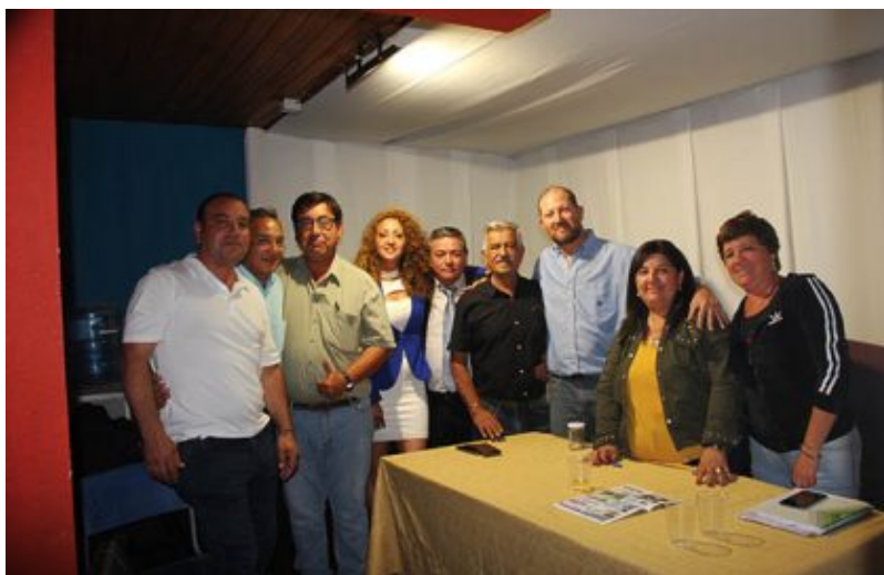
Foto postulantes diciembre de 2019 junto a Comisión Electoral

El 13 de diciembre se realizarán las elecciones en el Sindicato de Trabajadores a Honorarios de la Municipalidad de Maipú (STH). El horario de recepción de votos es desde