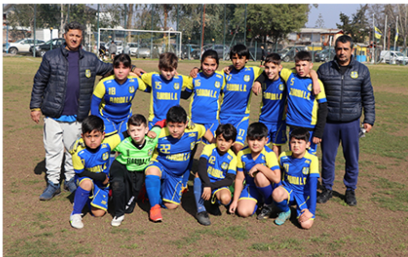
Cuarta infantil de Florida

Se juegan los últimos partidos del campeonato con un calendario que, a la fecha, permite jugar hasta la primera quincena de diciembre en forma holgada y sin apuro. Las infantiles o CADETES tiene como líder a Florida Loma Blanca. esta semana enfrenta a Joaquin Olivares.