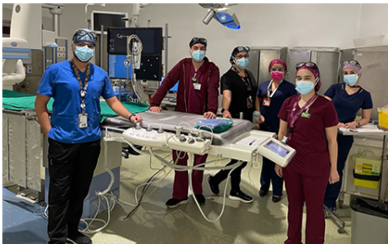
El equipo técnico-médico.

derecha, y que fue atendido en nuestro hospital en un procedimiento que se realizó exitosamente durante un poco más de una hora gracias al cual fue posible comprobar que además estaba afectada la arteria principal.