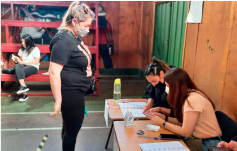
Mi niña sufragando

Se presume que Votarán 320 mil personas en Maipú y el 90% del padrón en todo Chile.