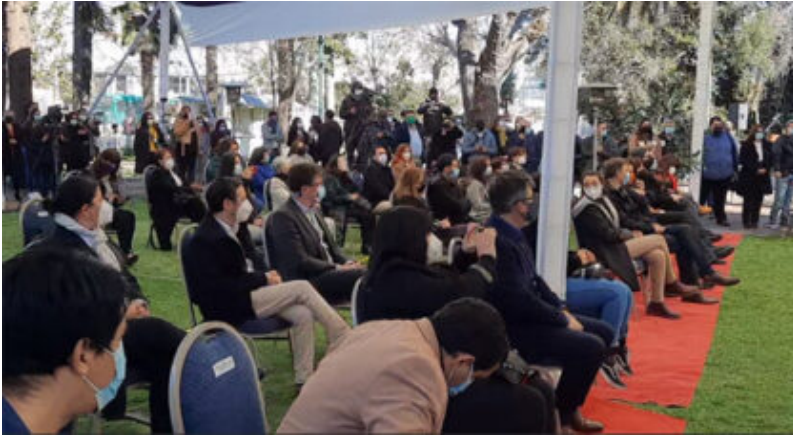
Foto archivo instalación de este coincideja que esta cumpliendo su periodo.

Este viernes 6 de diciembre de 2024 asume su segundo periodo alcaldicio el sociólogo Tomás Vodanovic, fecha de instalación del 9º Concejo Municipal pos dictadura, que tiene novedad 4 nuevos integrantes y por primera vez habrá oposición. La hora de inicio de la ceremonia está fijada a las 10:00 horas, trascendiendo un invitado estrella: Claudio Orrego.