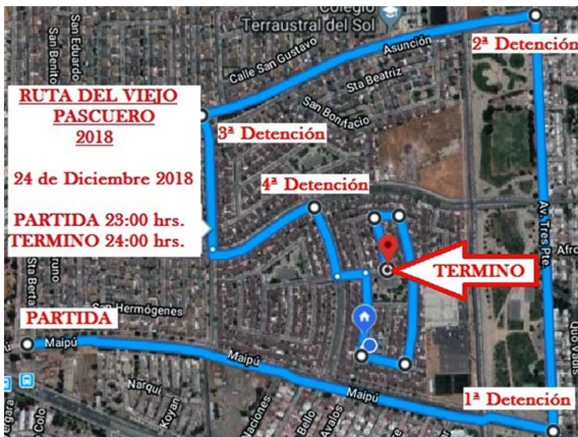
RECORRIDO DEL CAMION MAGICO

El motivo que los une es simple, aunque muy difícil en el mundo actual, menos sensible y más individualista: Sembrar amor en el corazón de un niño, sin duda alguna es la mejor inversión que las personas podemos hacer