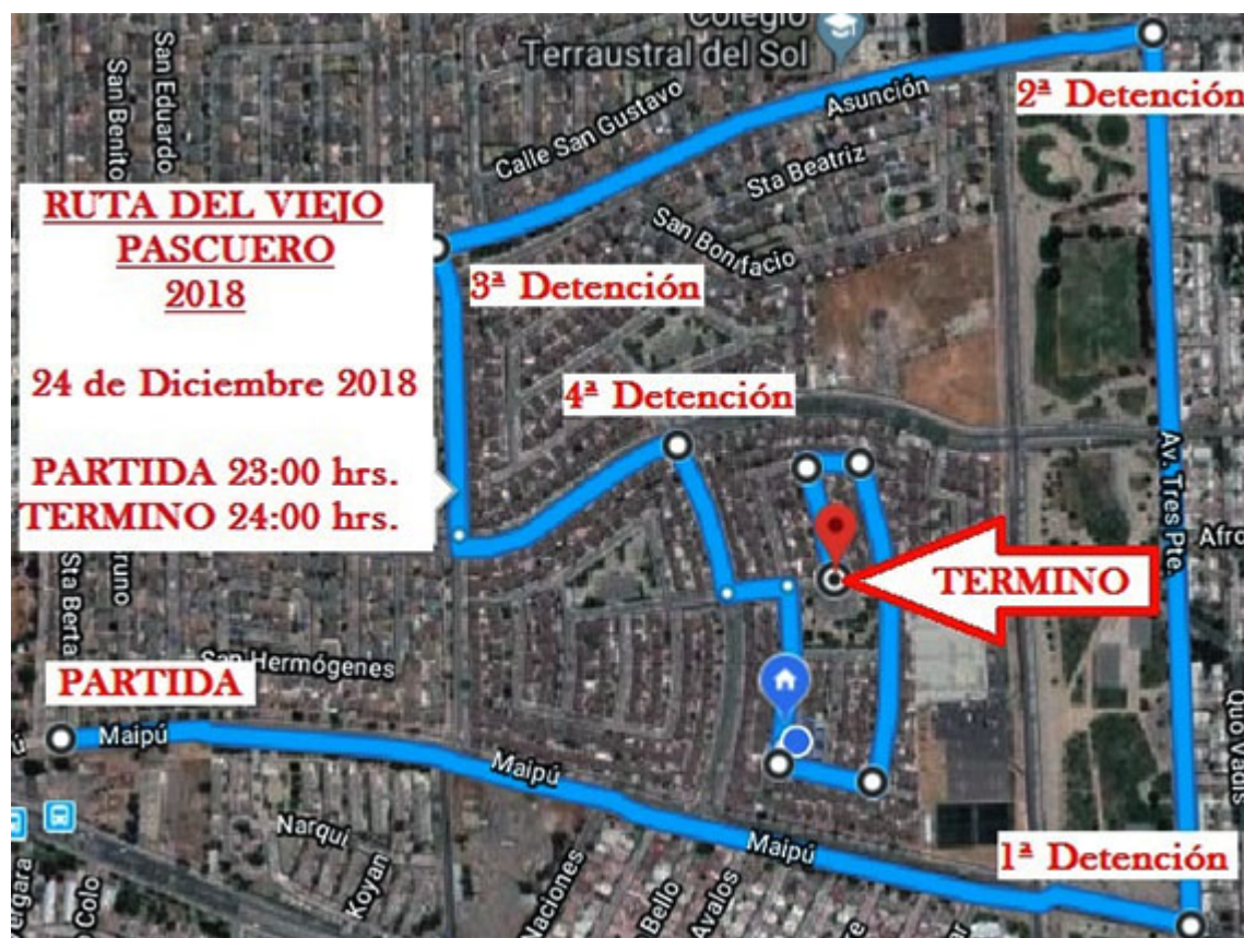
RECORRIDO DEL CAMION MAGICO

El motivo que los une es simple, aunque muy difícil en el mundo actual, menos sensible y más individualista: Sembrar amor en el corazón de un niño, sin duda alguna es la mejor inversión que las personas podemos hacer