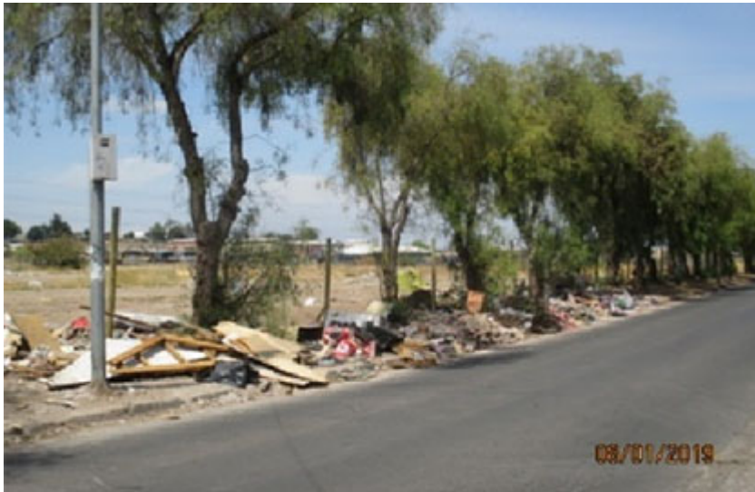
Foto de micro basurales enviada por la Coordinadora

Sin duda que los micro basurales no se crean solos, son vecinos del sector o cercanos al lugar que buscan deshacerse de artefactos y escombros a sabiendas que perjudican a otras personas y eso tiene un nombre: mal vivir; empero los afectados deben buscar soluciones y en eso esta empeñada la Coordinadora de Organizaciones Sociales del Barrio Lo Errázuriz que hacen un llamado a 8 diputados del distrito 8