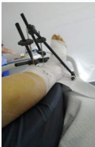
Foto enviada hoy tras intervención.

hizo el traslado al hospital El Carmen, luego que bomberos la entablillara. Al día de hoy, tras tres días del accidente, espera cama en el hospital El Carmen para ser intervenida quirúrgicamente.