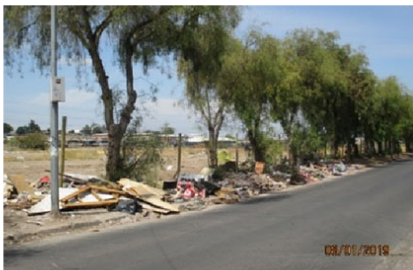
Foto de micro basurales enviada por la Coordinadora

Sin duda que los micro basurales no se crean solos, son vecinos del sector o cercanos al lugar que buscan deshacerse de artefactos y escombros a sabiendas que perjudican a otras personas y eso tiene un nombre: mal vivir; empero los afectados deben buscar soluciones y en eso esta empeñada la Coordinadora de Organizaciones Sociales del Barrio Lo Errázuriz que hacen un llamado a 8 diputados del distrito 8