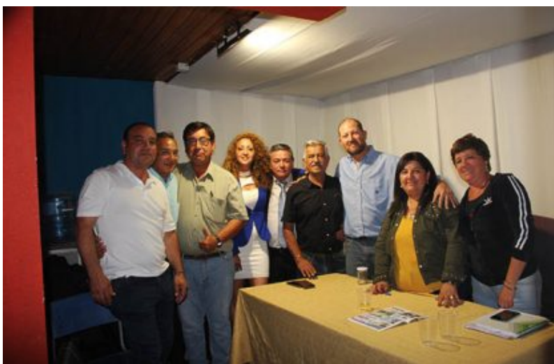
Foto postulantes diciembre de 2019 junto a Comisión Electoral