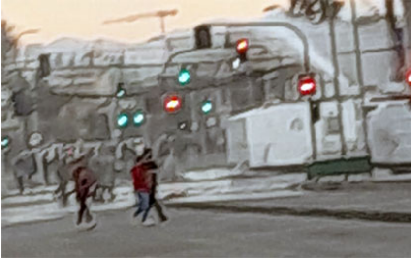
FOTO IMPACTO. 18:00 horas del 08 de agosto de 2022, continua el enfrentamiento de comerciantes ambulantes con carabineros en Av. Pajaritos con 5 de Abril. Este comenzó pasada las 11:00

luego que un grupo de comerciantes informales, que se les impidió instalarse en las calles del centro de la comuna se manifestaron duramente por recuperar los espacios laborales.