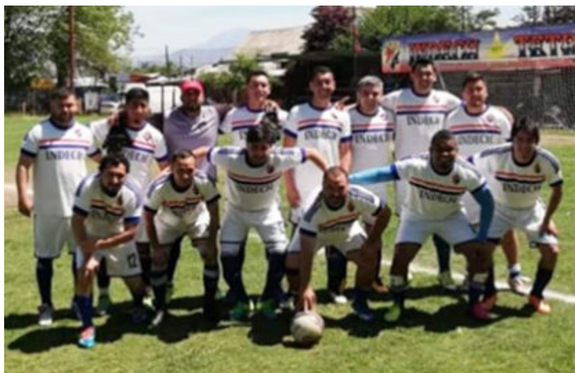
Senior "A" campeón